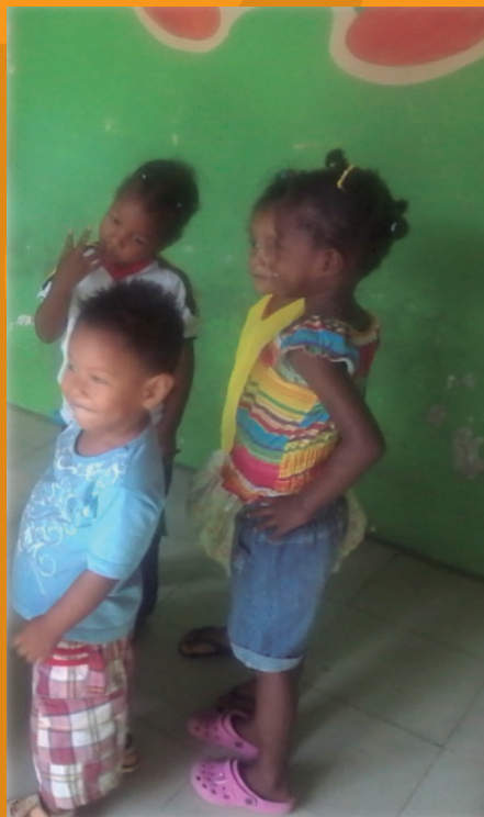
7.El mueve que mueve. Pista. Pitos y Tambores-Plan Nacional de Música para la Convivencia. Mincultura, 2004.