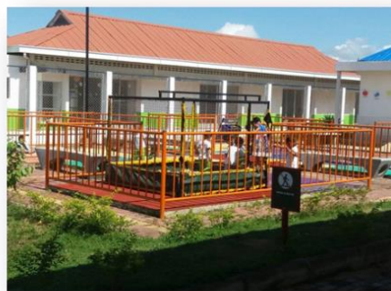
Tambo Nariño, CONPES 181 de 2015.

Gracias a la asistencia técnica de Coldeportes, desde 2015 los Documentos CONPES que distribuyen recursos del SGP para la atención integral de la primera infancia incluyen líneas de financiación que promueven la construcción, ampliación, adecuación, mejoramiento o dotación de ambientes lúdicos donde se promueve el ejercicio libre y autónomo de la participación de los niños y niñas, con el fin de impulsar su desarrollo integral. Es así como es posible que las entidades territoriales inviertan en: