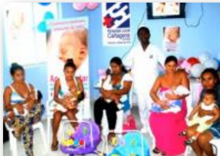
Programa Maternidad Segura de la ESE Hospital Local Cartagena de Indias - Bolívar