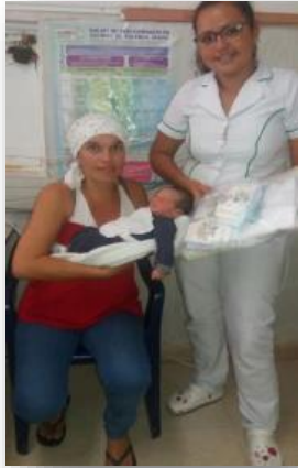
Mi primera muda. Hospital Nuestra Señora de Lourdes, Ataco – Tolima