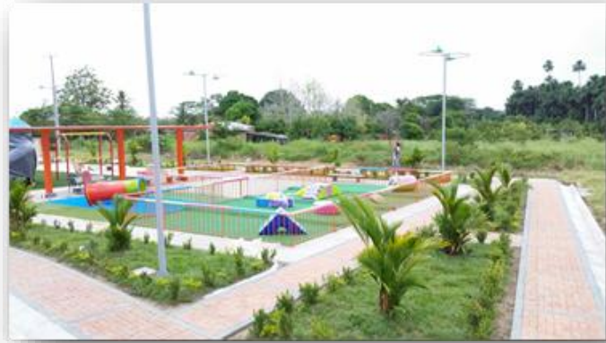
El Retorno - Guaviare, CONPES 181 de 2015

A través de sistema CHIP se pudo identificar que los municipios de Algoborro y Fundación, Magdalena; Pradera, Valle del Cauca; Tierralta, Córdoba; El Retorno, Guaviare; Valledupar, Cesar y Carurú, Vaupés, hicieron inversiones en esta línea. Adicionalmente, Coldeportes brindó asistencia técnica para la inversión en espacios lúdicos a los municipios de Aranzazú, Caldas; El Retorno y San José del Guaviare, Guaviare; Cumaribo, Vichada; Salamina, Caldas y Santa Rosa, Cauca.