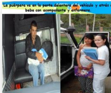
Plan cigüeña: Garantizando la continuidad de los servicios de salud. Hospital San Rafael, Pacho - Cundinamarca.