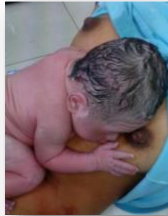
Atención humanizada a las familias gestantes: Cambiando la forma de nacer. Hospital San Juan de Dios, Sonsón - Antioquia.