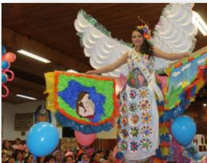
Grupo de apoyo a madres FAMI con la ESE municipal de Ipiales - Nariño

Complementariamente a la entrega del ajuar, se hizo una identificación de buenas prácticas asociadas a la captación temprana de gestantes por parte del sistema de salud, que dan cuenta de los resultados positivos de este tipo de estrategias para Colombia. Sobresalieron entre ellas: